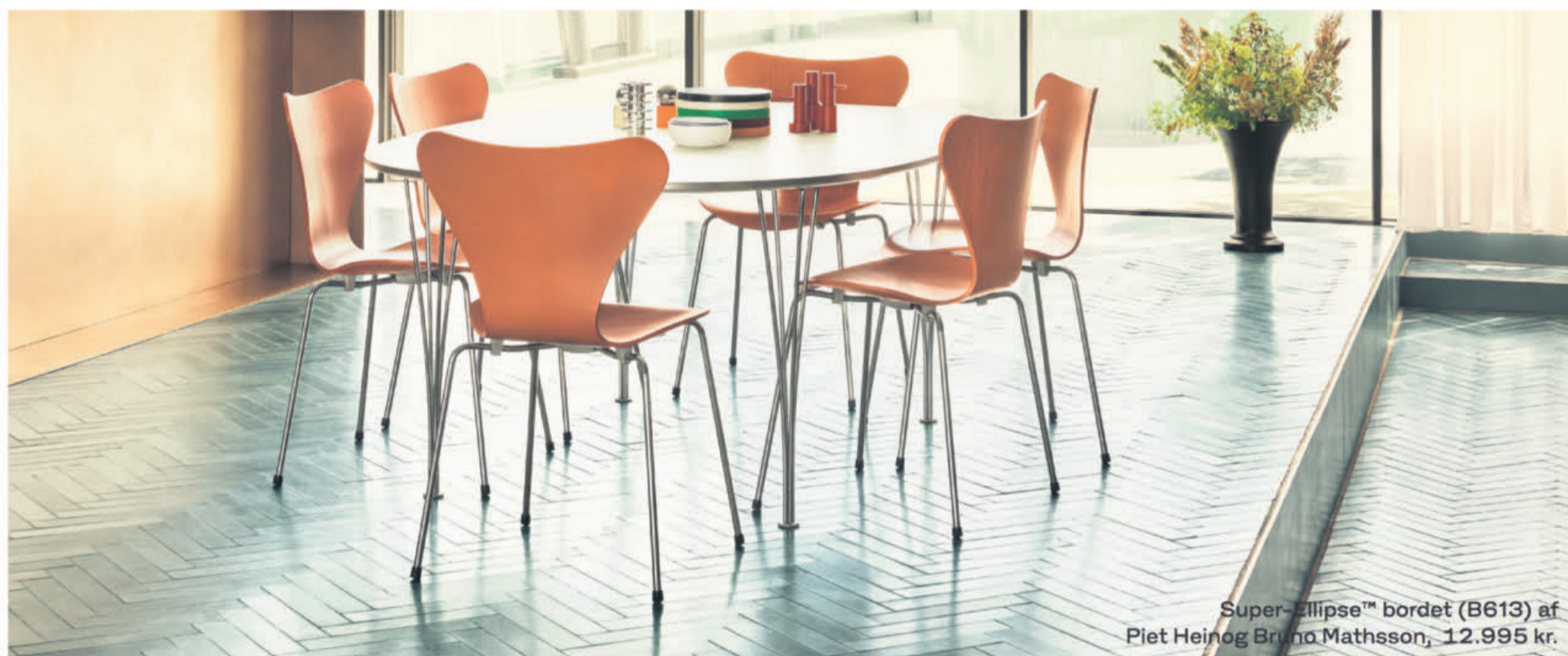
Super-Ellipse™ bordet (B613) af Piet Heinog Bruno Mathsson, 12.995 kr.

Evig elegant og alsidig - til hverdag og som udtræksbord til særlige anledninger. Super-Ellipse™ bordet tilbydes i alle størrelser med hvid bordplade til nedsat pris.