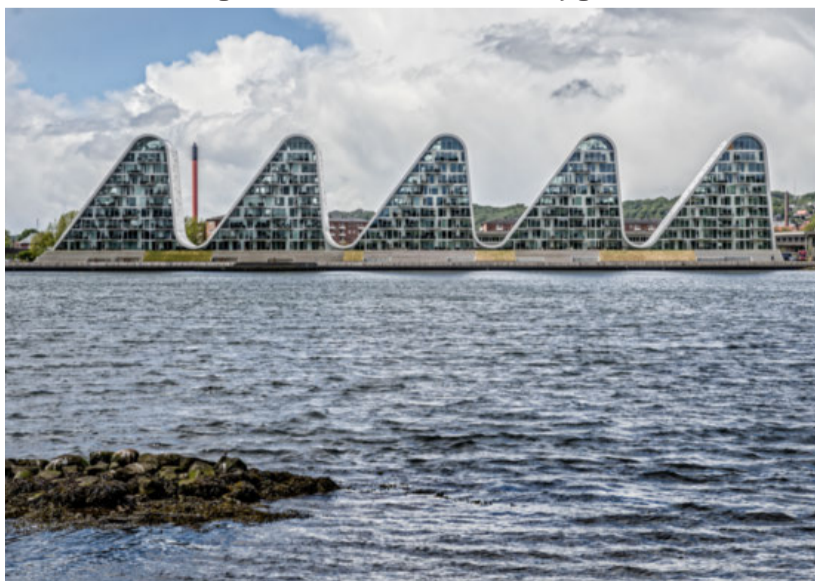
Bølgen ved Skyttehusbugten i Vejle.