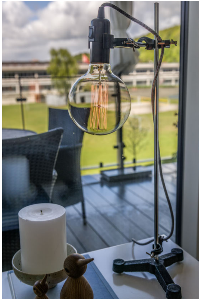
Lampen fra Kamikaze, der laver lamper af laboratorieudstyr, skiller sig ud i den ellers meget nordiske indretning.

Heller ikke møblerne skejer for meget ud. De fleste møbler er nye, nordiske design i lyse farver, som parret har kombineret med enkelte arvestykker. Men dengang ægteparret var begyndt at indrette lejligheden, var det, som om der manglede