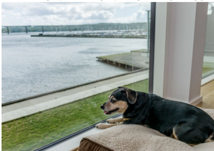
Hunden Fie ligger og nyder udsigten fra stuen.

I soveværelset vågner parret hver morgen op til udsigten over bugten. Sengegavlen er malet i den samme grønne farve som andre steder i lejligheden.